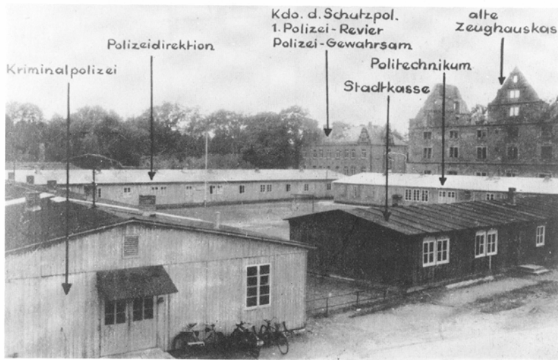
Städtische Notunterkünfte im Hof des Zeughauses (1946)

Als nämlich feststand, dass Herr Bayerlein sein Amt in Kürze abgeben musste, wurde in einer "Nacht- und Nebelaktion" zu einer Aufnahmeprüfung zur Zulassung zum