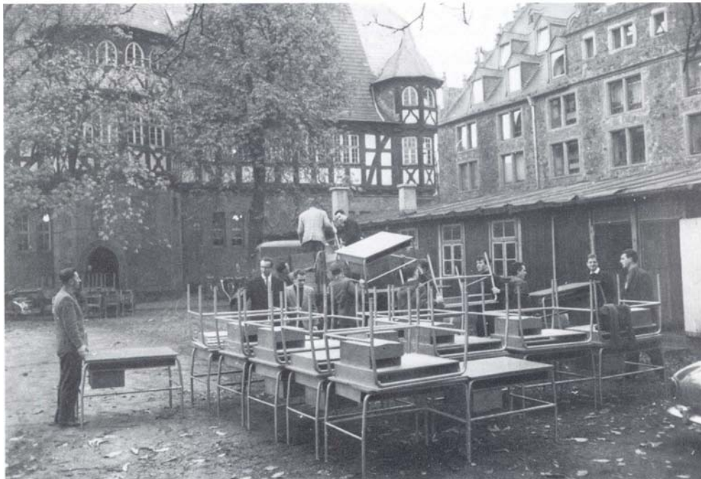
Umzug vom Neuen Schloß zur Wiesenstraße