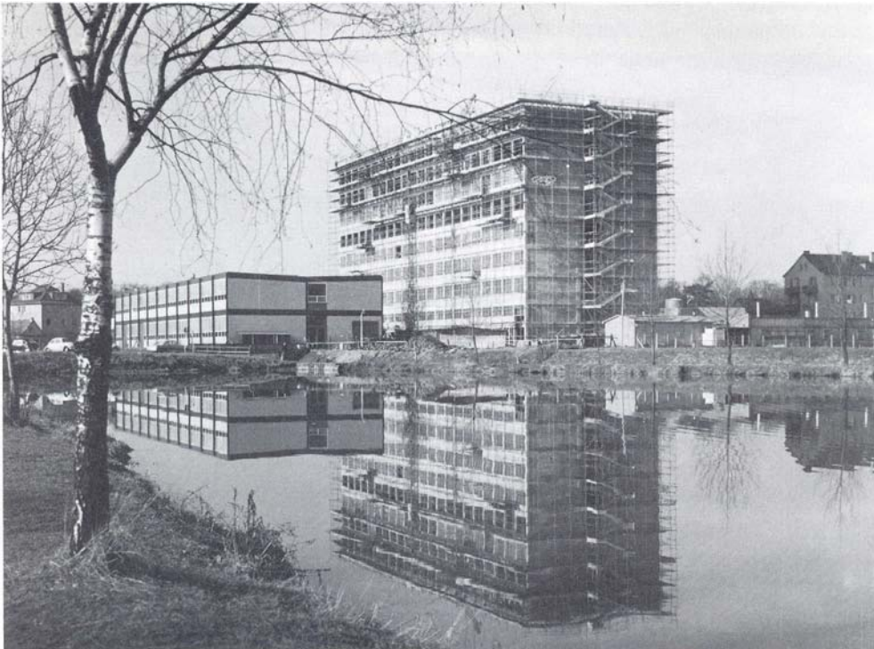
Ingenieurschulgebäude Wiesenstraße vor der Vollendung

Für die ersten Dozenten und Studenten nach dem Krieg eine eindrucksvolle Entwicklungsgeschichte von der Städtischen Ingenieurschule (Polytechnikum) Gießen im Jahre 1946 bis zur Fachhochschule Gießen-Friedberg 1971.