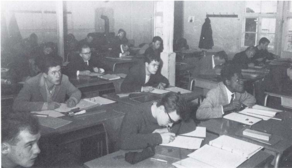
Klausur in der Notbaracke (1947)

Zuerst bekam die Hochbauabteilung den frischen Wind zu spüren, denn man war im Ministerium der Ansicht, dass zu viele Hochbauabteilungen in Hessen existierten. Der gesicherte Fortbestand und öffentliches Interesse mussten nachgewiesen werden. Dies war nur die Spitze eines Eisberges. In den folgenden Monaten geriet die Institution "Polytechnikum Gießen" in die Schusslinie, denn in Friedberg lief das wesentlich ältere Polytechnikum auf vollen Touren, und die Einstellung war damals weitverbreitet, dass man bei einem so zerstörten Land vor allen Dingen mehr Handwerker benötige.